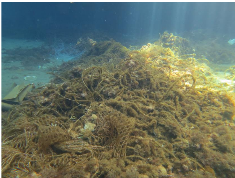
Reti a Marina Corta, Lipari

Invito per la stampa: Lunedì 8 ottobre, la stampa è invitata a salire a bordo di una delle imbarcazioni per assistere all'azione di rimozione delle reti dal mare. Posti a sedere disponibili limitati. Il punto di ritrovo sarà il centro immersioni La Gorgonia (S. Giuseppe, 98050 Lipari ME, Italia) alle ore 9:00.