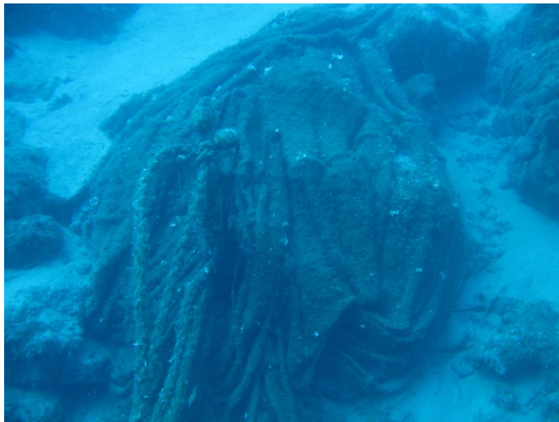
Rete a Punta Castagna, Lipari

Le aree di recupero interessate saranno concentrate in particolare fra Lipari, Vulcano e Salina cominciando da una grossa rete che si trova a Punta Castagna a Lipari, nella zona di Porticello.